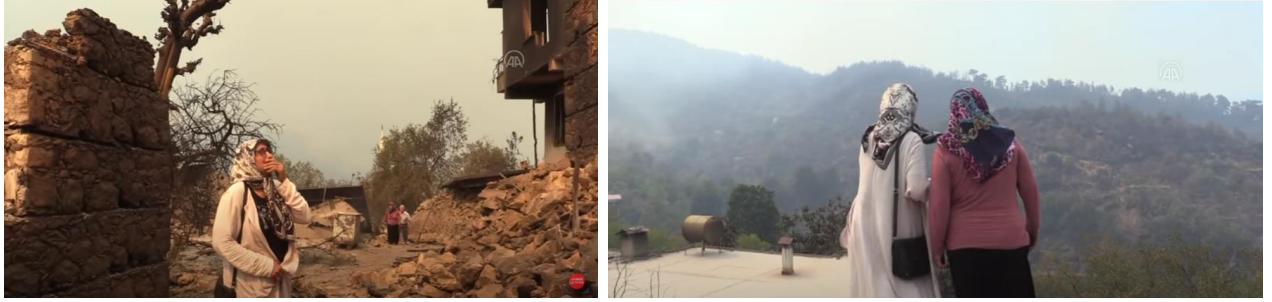
Resim 05 : Afetzedenin şu anda yapabildikleri tek şey, giden mahallelerine bakmak

*Yangının başlamasından kısa süre sonra evleri yanan herkesin banka hesabına 10.000.-TL gönderilmiştir. Daha sonra eşya yardımı olarak ta 25.000.-TL. banka hesaplarına yatırılmıştır. Konteynerle geçici barınma hızla sağlanmaktadır. İçlerinin tefrişleri hesaba yatan paralar ve gönderilen beyaz eşya yardımlarıyla tamamlanmaktadır.