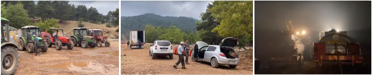
Resim 04: Ormana'da gönüllü dayanışması

Sadece Ormanalılarının yangını söndürmek için 30 arazözlü traktör, 2 büyük, 3 küçük jeneratörlü su pompası, üzerine su pompası monte edilmiş 2 kamyon, 11 adet 4*4 arazi aracı, 16 adet transit araç, 25 ağaç motoru, 2 adet 3,5 kw jeneratör ile destek verdiğini; yine Ormana'da faaliyet gösteren bir konaklama tesisinin 8 gün 25 görevliye oda tahsisi yaptığını ve yemeklerini karşılandığını bu süre içerisinde 400-500 kişinin aktif olarak çalışmalara katıldığını söylersem gönüllüğün ne kadar önemli olduğu vurgulamak açısından yeterlidir.