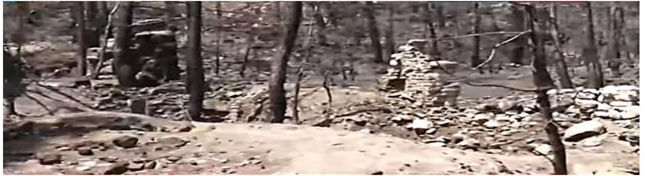
Resim 11 Lyrbe (Seleukeia) Antik kentinin bugünkü durumu

Bu örneklerle bundan sonra neler yapılmalıdır?