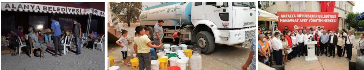
Resim 02 : Farklı belediyeler farklı yaklaşımlar.

Yangın alanında üç önemli gücü bir arada görüyoruz. “ Devlet-Yerel Yönetim-Yöne insanı ve STK ”lar. Biz bir arada görüyoruz ama onlar ne yazık ki bir arada değiller. Birliklilikleri çoğu zaman aynı mekanda bulunmaktan öte geçmiyor, ya da medya karşısında el sıkışmaktan öteye. Buda, daha işin başında bu gücü güç olmaktan çıkıyor.