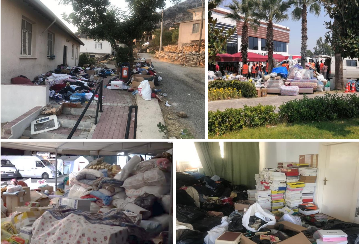
Resim 05 : Cami önüne, yol üstüne, belediyelerin çadırlarına vb. bırakılmış sahipsiz eşyalar.

sıcak altında kalmıştır. Gelen yiyeceklerin çoğu bozulmuştur. Daha sonra Manavgat Belediyesi açık alana kurdukları depolama mekanı ile sorunu çözmüştür. Kullanılmış eşya göndermeyin diye defalarca sosyal medyadan duyuru yapılmasına rağmen gönderilen eski eşyalar yeterince ayrıştırılmadığı için afetzedeleri rencide eden çok sayıda olayla karşılaşmıştır. (Örneğin orman köylüsü kadınlara gönderilen kullanılmış bikini ve mayolar, şortlar veya topuklu ayakkabılar)