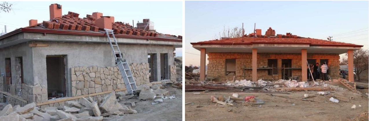
Resim 08 : TOKİ'nin Karaöz mahallesinde inşa etmekte olduğu örnek konut.