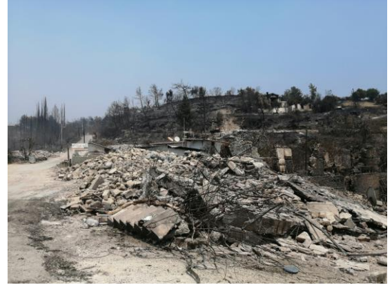
Resim 09-10 : Bölgede yangından etkilenen ören yerleri ve Kepezbeleni Mahallesinin bugünkü durumu