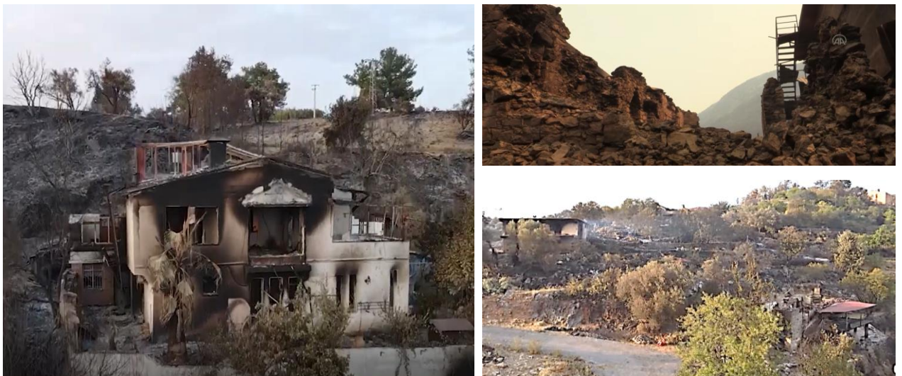
Resim 06 : 28 köy tamamen yanmış durumda. Sadece 1 köyün camisi, 1 köyün muhtarlık binası ayakta kalmıştır.

*Bir diğer sorun ise; çok daha önce çeşitli nedenlerle köyden göç nedeniyle boşalmış ve harabe haline gelmiş evlerin yangında hasar görmüş şekilde tespitine çalışanlardır. Bu konuda yetkililerin çok hassas davranması gerekmektedir.