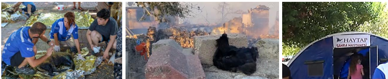
Resim 06 :Gönüllülük bu olmalı.

Yangının ilk çıktığı andan itibaren uzun süre (ki başka afetlerde de aynı hata yapılıyor) basın ve sosyal medyanın çoğunun “tek tesellimiz can kaybı olmaması” açıklaması, insan dışındaki canlıları yok saymaları çok üzücüdür. Oysa çok sayıda canlı yangın alanında can vermiştir. Önce sayısı dört olan sonra artan gönüllü veterinerlerin hiçbir ücret talep etmeden hayvanların tedavilerini üstlenmeleri, yangın alanına giderek orada yaralı hayvanları tespit ederek tedavi etmeleri, tedavisi yangın alanında imkansız olanların tedavilerini kliniklerinde sürdürmeleri, ilaçlarını vermeleri ise gönüllüğün somut örneğidir. Buna çok sayıda hayvan hastanesinin katılması örnek davranışlardır. Hepsini gönülden kutlamalıyız