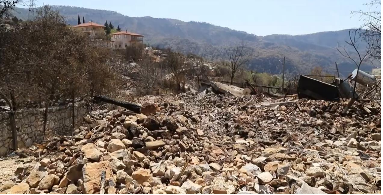
Resim 07 : Yöreye özgü Düğmeli Evleri ile ünlü Kepezbeleni köyünde geleneksel yapıların çoğu yok oldu..

Bölge orman zenginliği kadar ören yerleri ve geleneksel köy dokusuyla önemlidir. Özellikle Torosların kuzeyine doğru “düğmeli evler” ile ünlü köyler bulunmaktadır. Orman köyleri içinde aynı şeyi söyleyebiliriz. Örneğin Kepezbeleni Köyü tamamen yanmıştır. Yanan evlerin çoğu düğmeli evdir. TOKİ tarafından yapılacak yapılarda bu değerler göz önüne alınacak mı? Şu ana kadar yöreden herhangi bir katkı talebi olmamıştır. Bölgede bulunan üniversitelere de başvuru yapılmamıştır. TOKİ'nin web sayfasında yayınlanan projeler kırsal kesimler için önceden hazırlanmış tip projelerdir. Bunlardan bir tanesi hızla örnek proje olarak inşa edilmektedir. Beton bina üzerine taş kaplama bu kaygılarımızı arttırmaktadır. Ahşap tavanlar, kalem işi duvarlar, özel ahşap kapılar, trakalar, dökküler vb. Geri dönüşü olmayan değerler olarak yitip gidecek mi? Kısa süre sonra bildik “ TOKİ MİMARİSİ ” ile karşılaşmamız olasıdır.