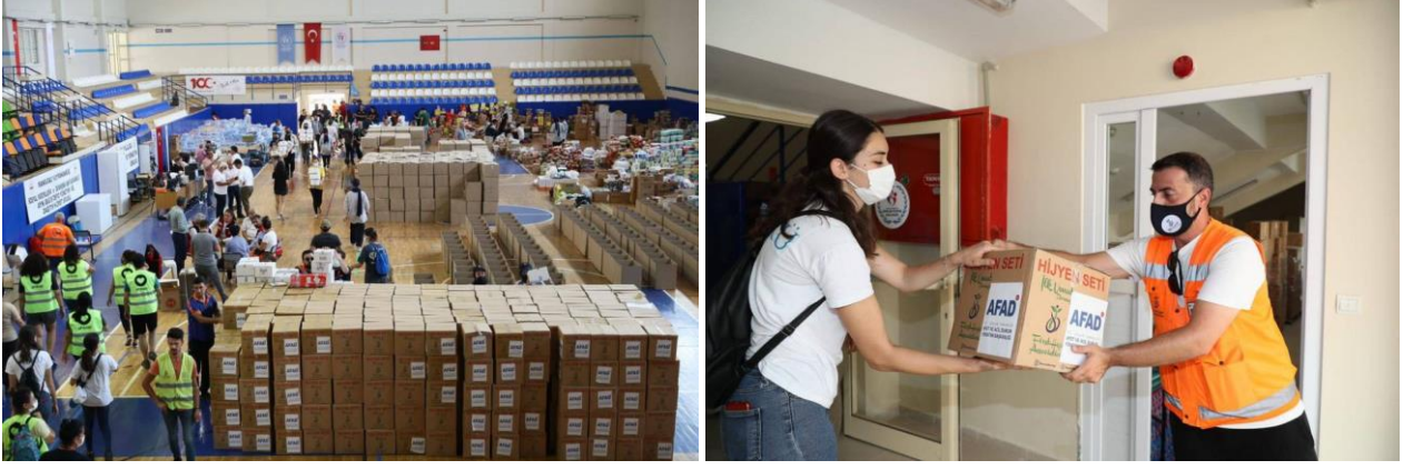
Resim 03 :Manavgat AFAD gönülleri çalışması

Ancak AFAD'ın görevi sadece bu değildir. Yukarıda açıkladığım gibi tanımından başlayarak tüm bileşenleri bir araya getirmektir esas görevi. Ancak ayrıştırıcı politikaların yanlışlığını burada da somut olarak görülmüştür. Yerel Yönetimlerde, Merkezi Hükümette devletin esas unsurlarıdır. Yurdun çeşitli bölgelerinden gelen gönüllere destek öncelikle yerel dinamiklerdir. Yöreyi, orman içini, yardıma katılacak kurumları ve kişileri, ulaşılabilecek yolları, temin edilecek vasıtaları vb. en iyi yerel yönetimler, muhtarlıklar, yörede görev yapan odalar ve STK bilmektedirler. Onlardan uzak durmak onları dışlamaya çalışmak başta AFAD olmak üzere diğer devlet kurumlarına iş yükü getirmiştir. Bu gibi durumlarda, iyice değerlenen zamanın kaybına sebep olmuştur. Örneğin organizasyonda yaşanan sorunlardan dolayı bölgeye görevi olan, olamayan herkes rahatça girebilmiştir. Kolluk kuvvetleri bir güvenlik zaafı olabileceğini sezmiştir. İlk anda hiçbir önlem almayan, alana girişin ne şekilde olacağını belirlemeyen bu güçler kısa süre sonra gece yarısı konaklama yerlerinden, gönüllü olanları alıp sorgulamak, üstelik hiçbir resmi tutanağa dönüştürmeden bir süre sonra salıvermek, oraya hizmet için gelen gönüllülerin gönülünü kırmaktan öteye geçmemiştir.